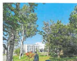
南町親睦会花壇花植え