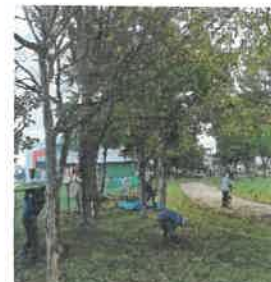
いなほ公園草刈り参加